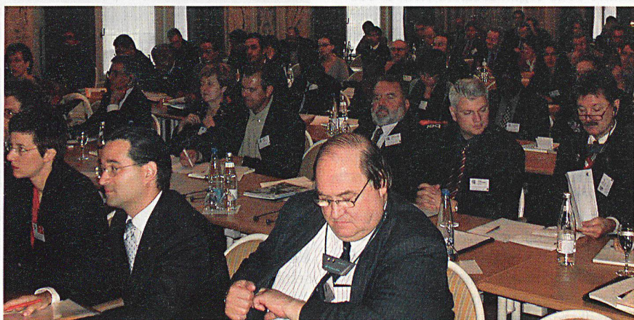
Al Congresso di Berna hanno partecipato 77 delegati di 63 nazioni, ...