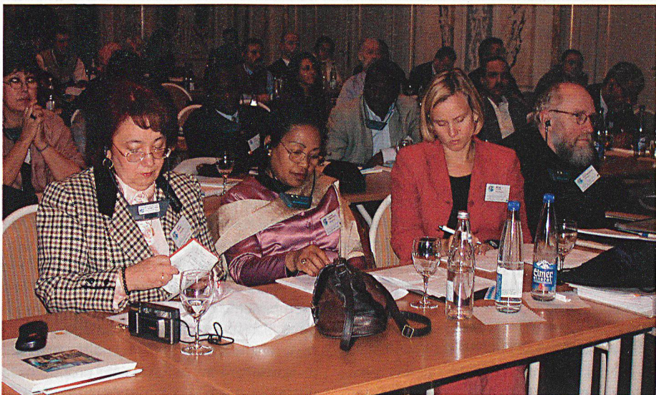
... come pure ospiti e rappresentanti di diverse organizzazioni.

manifestazione. È ancora presto per sapere quali saranno gli effetti del Congresso sulle future attività internazionali nel campo dei beni culturali. Esso ha però sicuramente contribuito ad accelerare i tempi previsti per l'entrata in vigore del secondo protocollo aggiuntivo, che nel frattempo è stato ratificato dal quindicesimo Stato.