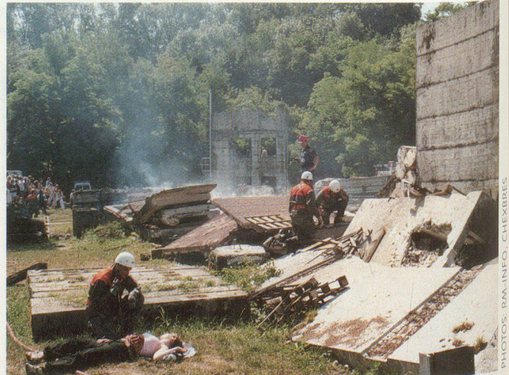
Le détachement Goupil entre en action.