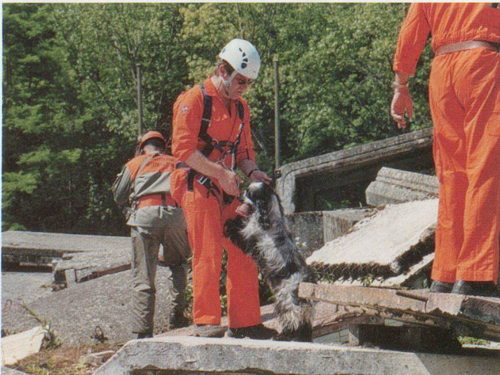
«Pirate» va entrer en action.