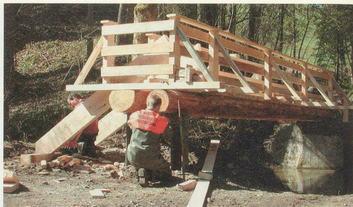
Neue Wanderwegbrücke bei der Brisigmüli an der Grenze Schwellbrunn/Urnäsch: Insgesamt baute allein die ZSO Hinterland fünf solcher Brücken.