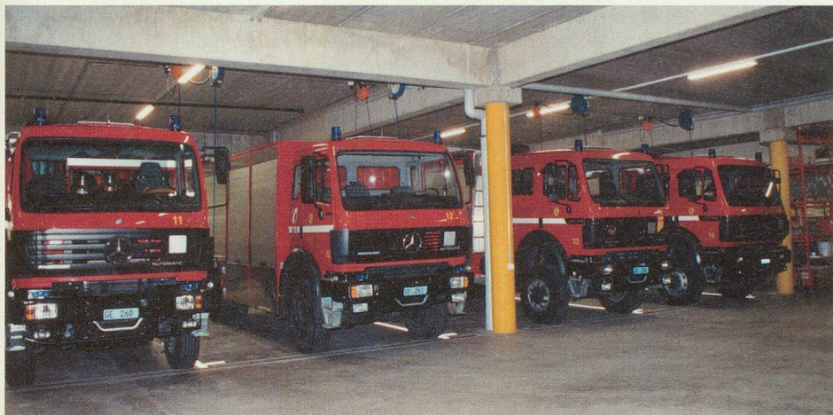
Les imposants camions mis à disposition dans le cadre du plan Carbura.

Cette présentation a été suivie d'une visite du bâtiment, sous la conduite du capitaine Pascal Fleury, commandant des sapeurs-pompiers de Vernier. □