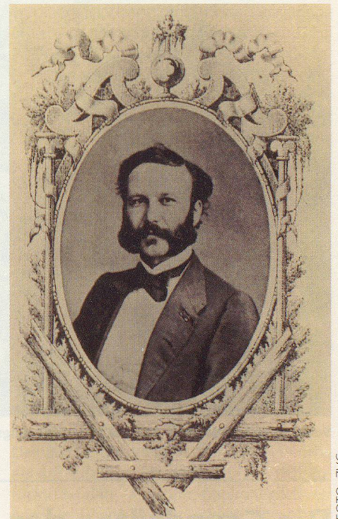
Henry Dunant, 1863.

Dunant fasste seine Gedanken und Erfahrungen im Buch Eine Erinnerung an Solferino zusammen und startete einen Aufruf an die Weltöffentlichkeit, in allen Ländern Vereine zu bilden für die Hilfe an Verwundeten. In der