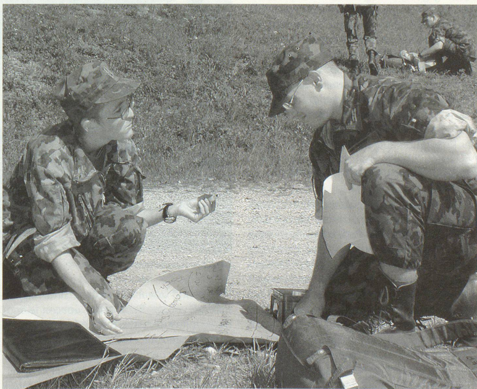
Die Präsentation eines Konzepts gehört zur militärischen Kaderausbildung.