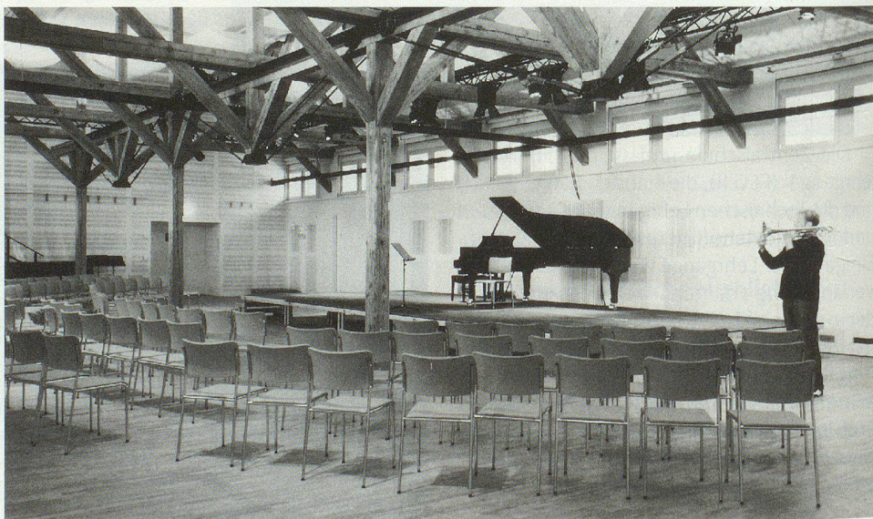
Saal der Hochschule für Musik.

Die Baudirektorin des Kantons Bern ist überzeugt, dass sich die Investitionen gelohnt