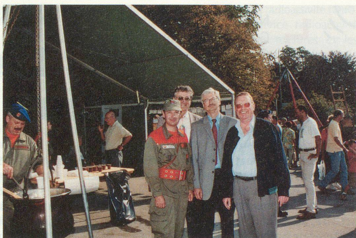
Des visiteurs de marque (ils se reconnaîtront).