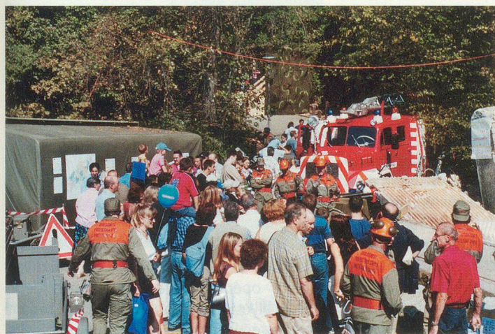
La PCi lausannoise en pleine démonstration.