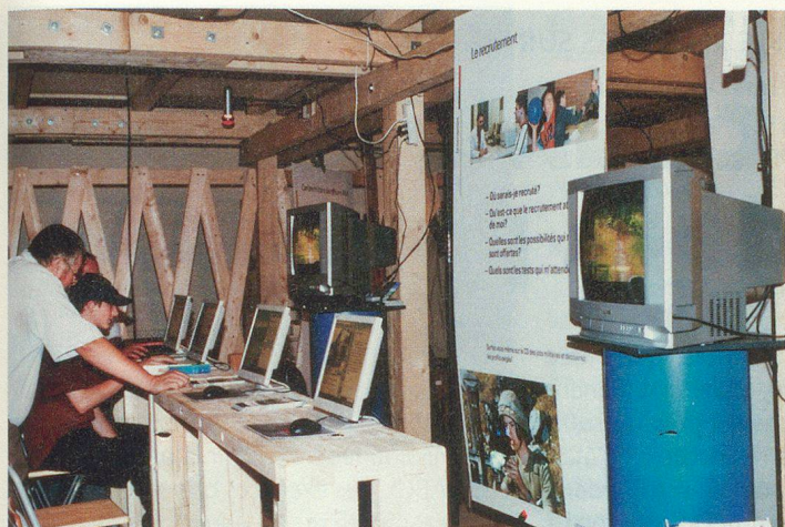
Le coin recrutement (armée et PCi).