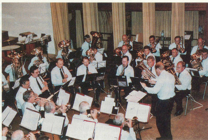
Tout se termine en musique: la fanfare de la PCi cantonale vaudoise.