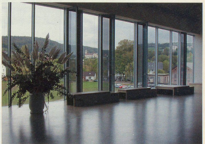
Durch grosse Fenster dringt viel Tageslicht.

dass das Projekt Rekrutierung und die Realisierung der Zentren innerhalb von vier Jahren realisiert und umgesetzt werden konnte.