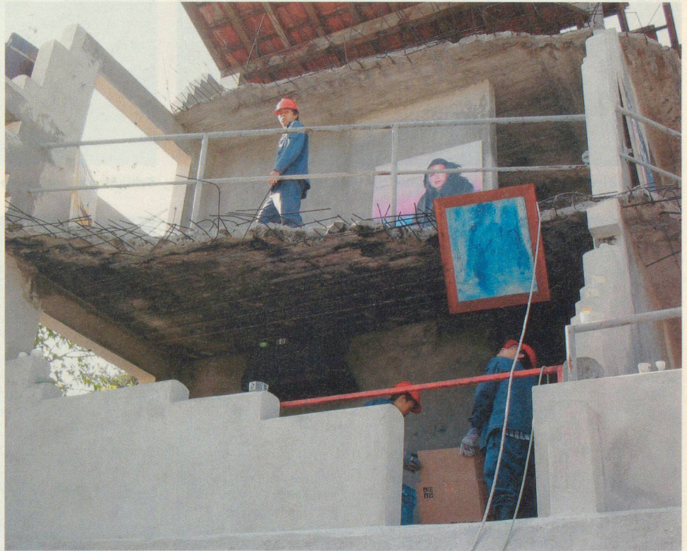
Evaluierung von Kulturgütern.

BABS. Die Bevölkerungsschutzreform bringt für die Ausbildung im Kulturgüterschutz (KGS) verschiedene Änderungen. Die KGS-Spezialisten des Zivilschutzes haben nicht nur eine längere Ausbildung zu absolvieren. Es wird vor allem auch mehr Gewicht auf die Zusammenarbeit mit den Partnerorganisationen gelegt. Genf hat die neue Ausbildung erfolgreich getestet.