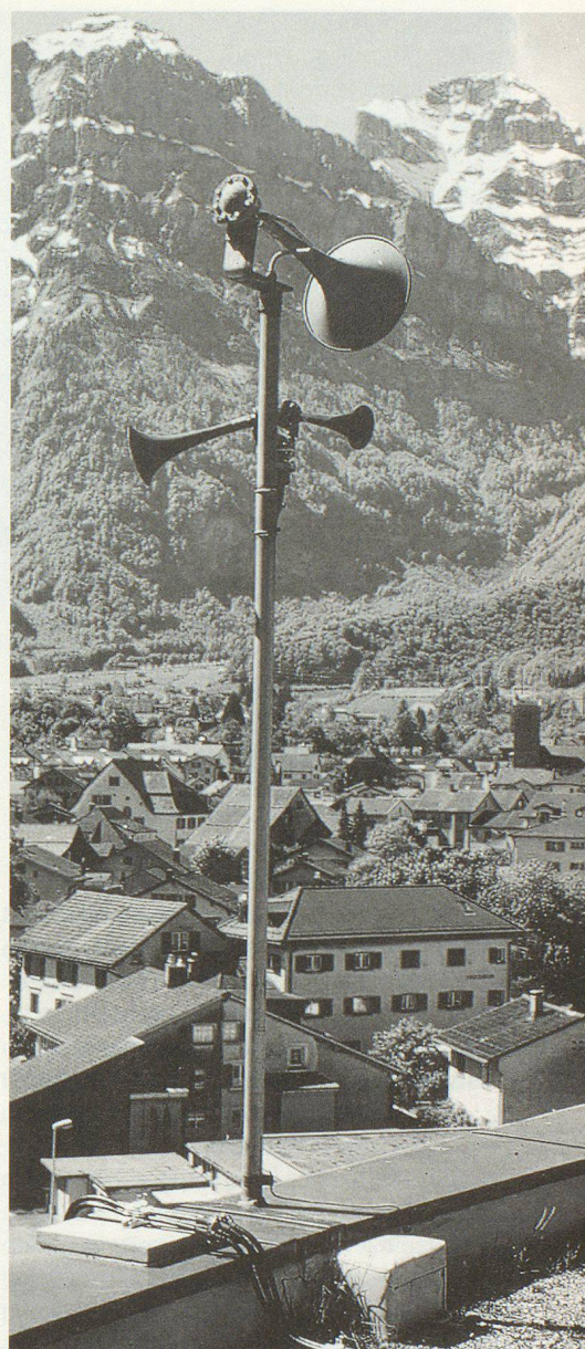
Il 4 febbraio 2004 verranno testate anche le sirene per dare l'allarme acqua.

Si parte dal presupposto che in caso di pericolo sia possibile dare l'allarme ad oltre il 99,5% della popolazione svizzera per mezzo di sirene fisse e mobili. In caso effettivo, gli abitanti di case discoste vengono avvisati per telefono. Per garantire che i segnali raggiun-