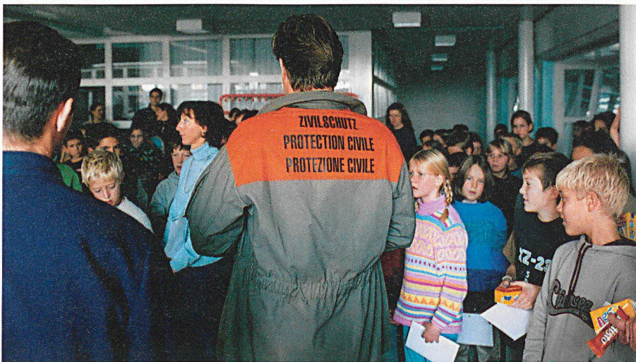
Zum Abschluss das Dankeschön der Rettungsdienste an Lehrerschaft und Schüler.

Die Lehrerschaft, die Schulpflege und die Rettungsdienste Meilen haben heute unter Umständen (über-)lebenswichtige Erkenntnisse gewonnen, und es gilt, die Lehren in Form von angepassten Konzepten und Training zu verinnerlichen und zu erweitern. Um dem Unerwarteten auch in Zukunft zwar überrascht, aber nicht unvorbereitet gegenüberzustehen. □