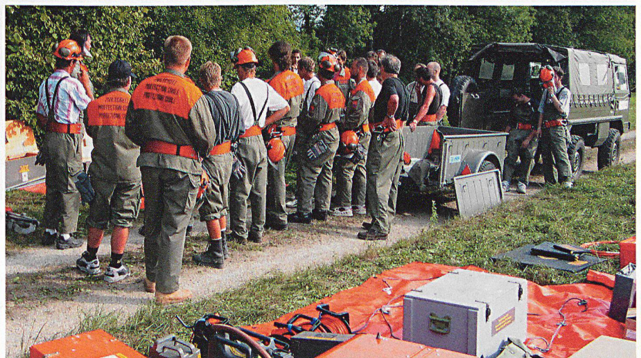
Ein gutes Briefing motiviert.