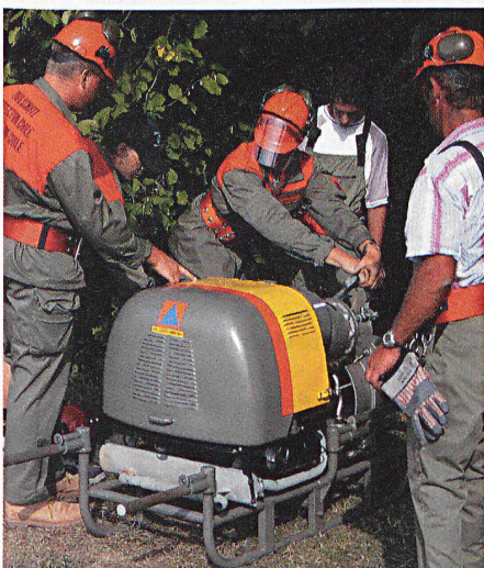
Demonstrieren, Instruieren und Üben.