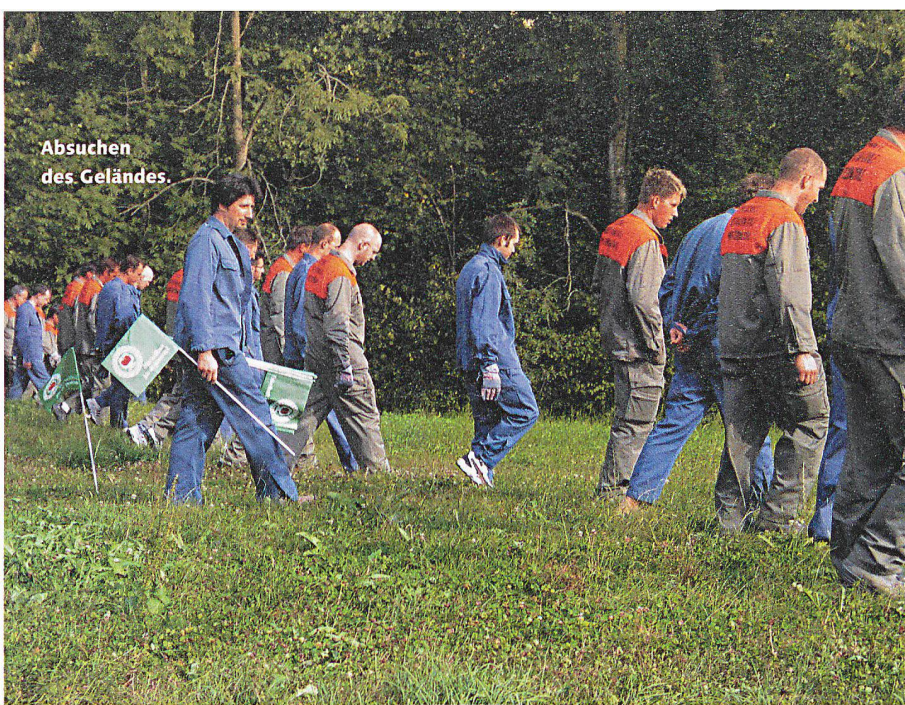
Absuchen des Geländes.

AMRISWIL: ANSPRUCHSVOLLER WIEDERHOLUNGSKURS