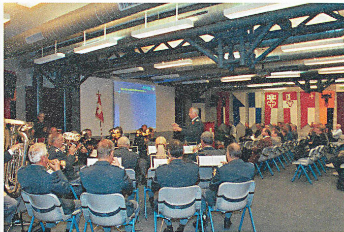
Bienvenue par la fanfare de la Landwehr.