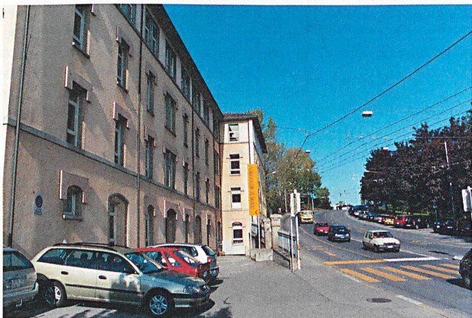
L'entrée nord du Centre de recrutement.