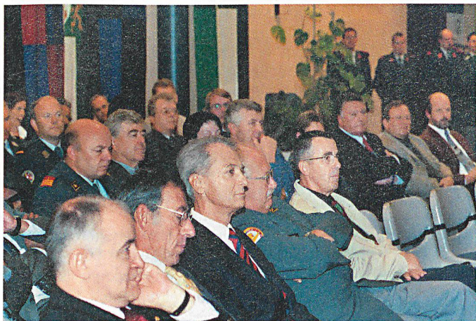
Beaucoup de personnalités pour l'inauguration.