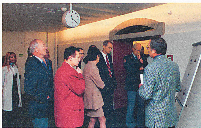
Le médecin-chef explique les principales causes d'inaptitudes.