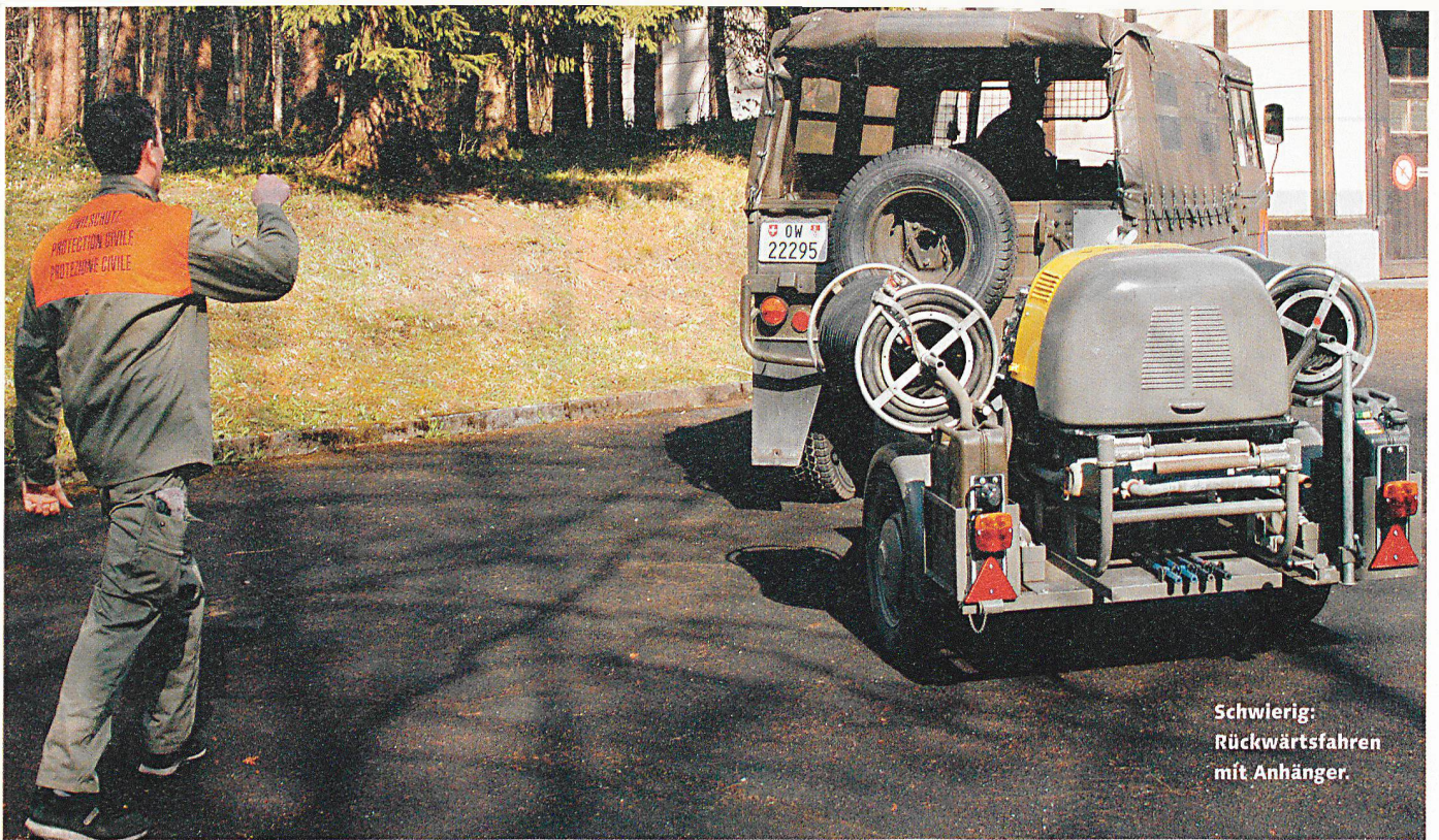
Schwierig: Rückwärtsfahren mit Anhänger.