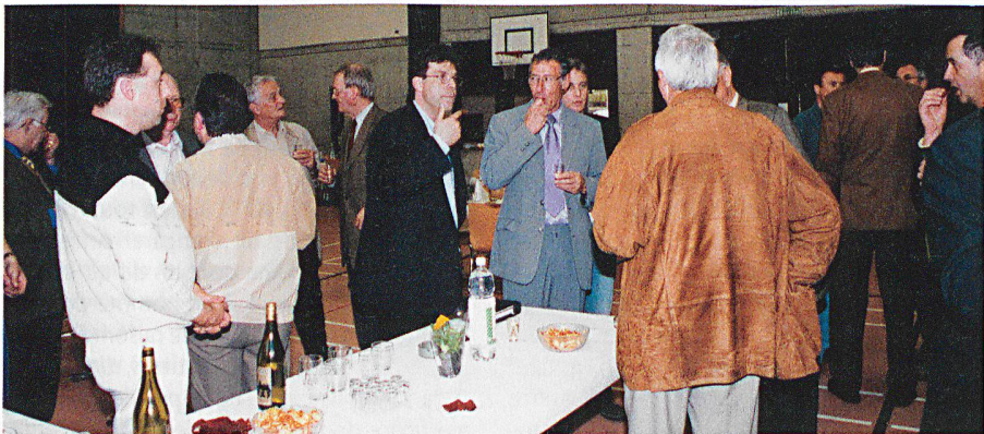
L'heure des petits fours pour les participants.