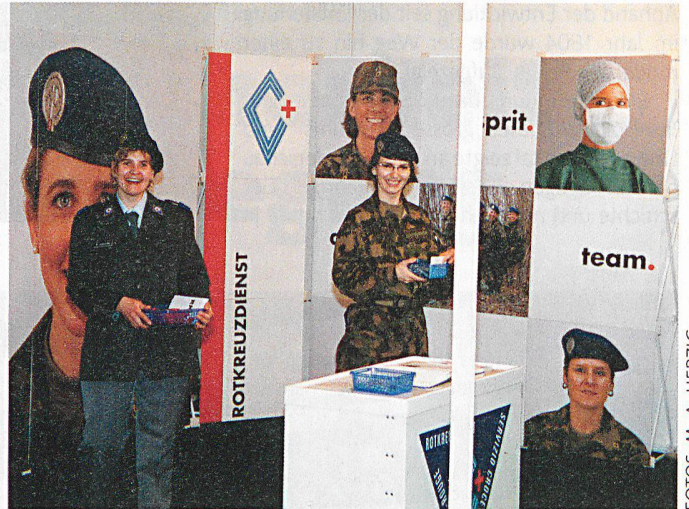
Der Rotkreuzdienst (RKD), ein Teil des Armeesaniätätsdienstes – ist eine Gemeinschaft hoch spezialisierter Fachfrauen aus den Bereichen Pflege, Medizintechnik und Medizintherapeutik, Ärztinnen, Apothekerinnen usw.