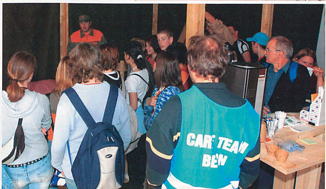
... und hier während des Besucheransturms.