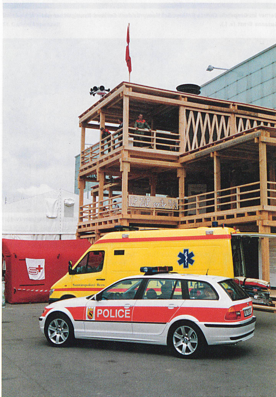
Partner im Bevölkerungsschutz zeigen sich gemeinsam: Polizei, Gesundheitswesen, Samariter und Zivilschutz, zuoberst auf dem Pavillon, in welchem auch das Labor Spiez und die NAZ untergebracht waren.

Eindrücklich auch die Präsentation der Berner Kantonspolizei in Zusammenarbeit mit der Stadtpolizei Bern betreffend ihren «courant normal» wie Verkehrssicherheit, Einbruch, Diebstahl, Drogen, Medikamente usw. Die Grundlage zum Ausstellungskonzept bildete das 200-Jahr-Jubiläum der Kantonspolizei.