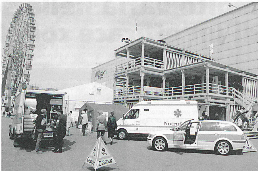
In fondo la torre con protezione civile, Laboratorio di Spiez, CENAL e Polycom.

Informazione del DDPS per i media, 3 maggio 2004