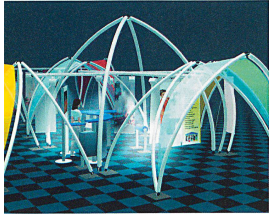
Das neue Standbaumaterial «Sydney» ist hell, durchlässig und multivariabel einsetzbar.