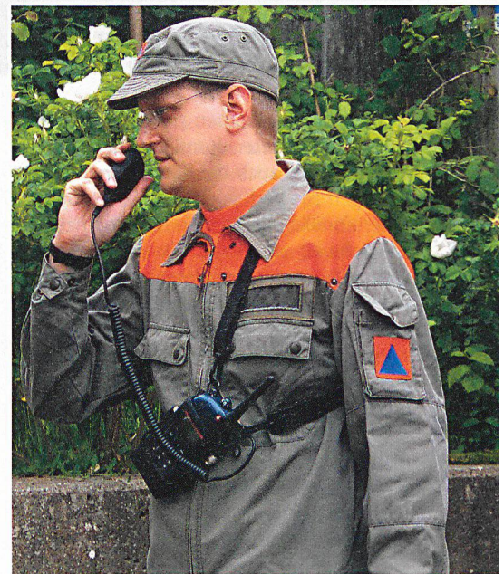
Polycom – das moderne Funk- Führungsmittel.

AWITEL/AWINAP, Polycom, Local Area Network LAN, automatische Telefonvermittlungsanlagen TVA, universelle Kommunikationsverkabelungen UKV. □