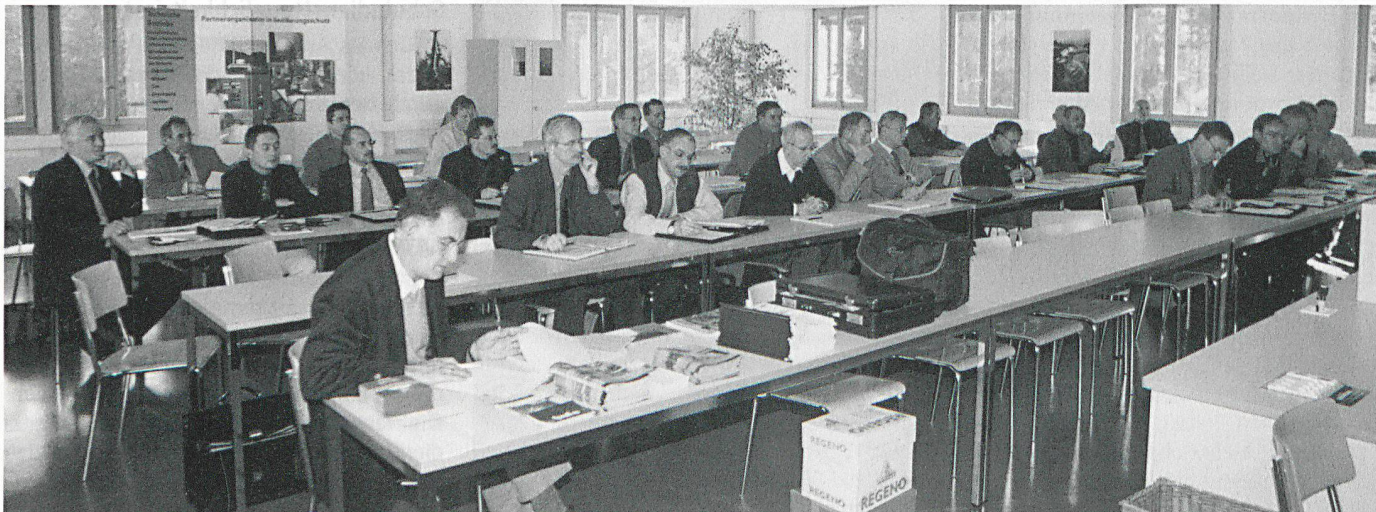
Aufmerksames Auditorium in Sempach.