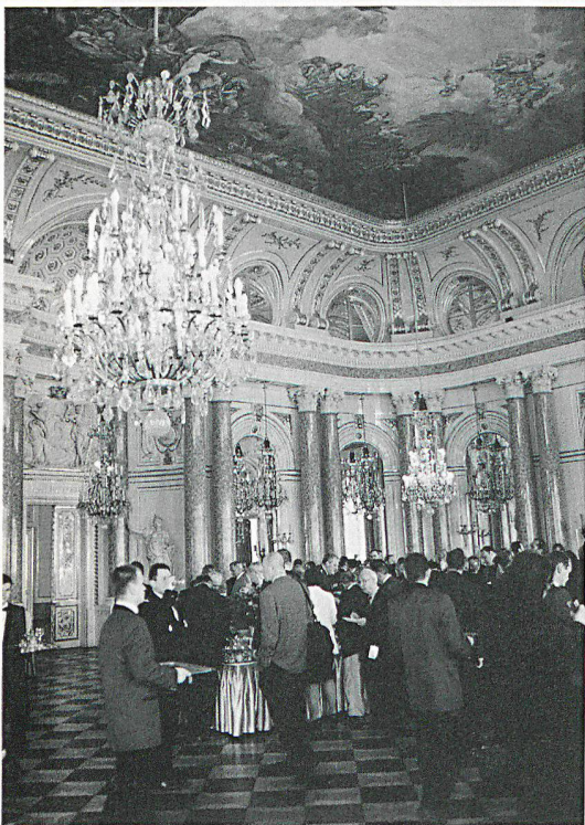
Das «Royal Castle» als würdiger Tagungsort.

Die Beispiele aus dem militärischen Bereich zeigten, dass zurzeit nicht nur der Respekt vor dem Menschenrecht weitgehend fehlt, sondern nach wie vor auch die Belange des Kulturgüterschutzes zu wenig in die militärische Ausbildung integriert werden. Insgesamt – so das Fazit – soll durch vermehrte internationale Zusammenarbeit und gegenseitige Unterstützung unter den Signatarstaaten, der Unesco und den Nichtregierungsorganisationen weiter Überzeugungs- und Sensibilisierungsarbeit geleistet werden. □