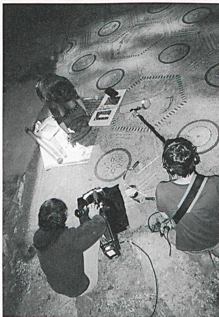
Auch im Musée romain in Vallon FR wurde eine Szene gedreht.

am selben Drehort über in die heutige Zeit, wo anhand weiterer Szenen die KGS-Aufgaben und -Arbeiten erläutert werden (zum Beispiel Inventarisierung, Kurzdokumentation, Evakuierung, Ausbildung, Sicherstellungsdokumentation und Mikroverfilmung usw.). Auch die Zusammenarbeit mit der Feuerwehr oder jene mit der Denkmalpflege und Archäologie, mit Archiven, Bibliotheken und Museen wird aufgezeigt.