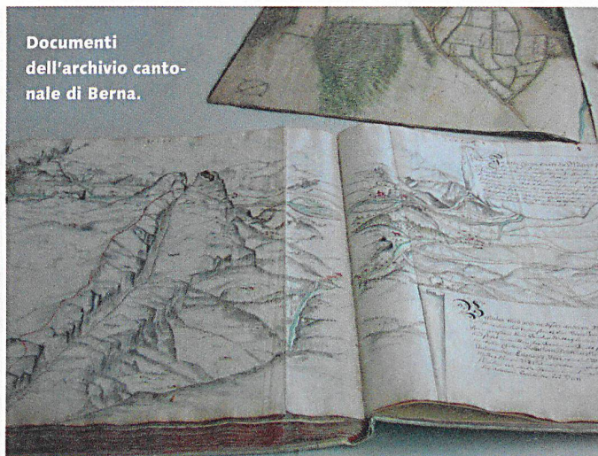
Documenti dell'archivio cantonale di Berna.

La difficoltà principale per il regista è stato concentrare la varietà dei beni culturali delle diverse regioni svizzere e la molteplicità dei compiti della PBC in un video di pochi minuti. Non era quindi possibile procedere a tappe («prima questo, poi quello», ecc.), i vari temi andavano trattati in forma di scene brevi e incisive. Il regista Jürg Ebe ha cercato di raggiungere questo obiettivo mescolando scene del passato e del presente. Dopo una sequenza di immagini di beni culturali di tutte le regioni svizzere, il video presenta alcuni compiti principali della PBC in cinque parti. Ogni parte è introdotta da una scena storica (passeggeri di un battello della Belle Epoque, scena romana a Augusta Raurica, scene medievali nel castello di Hallwyl e davanti a una chiesa di Baden, biblioteca barocca nel convento di Engelberg). Un cambio di scena ci riporta nello stesso luogo delle riprese ai giorni nostri, per illustrare i compiti e le attività della PBC (inventariatura, documentazione succinta, evacuazione, istruzione, documentazione di sicurezza, microfilmaggio, ecc.).