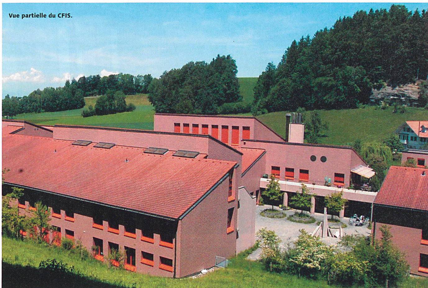
Vue partielle du CFIS.