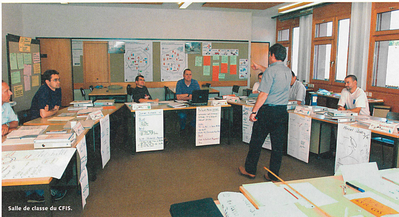
Salle de classe du CFIS.