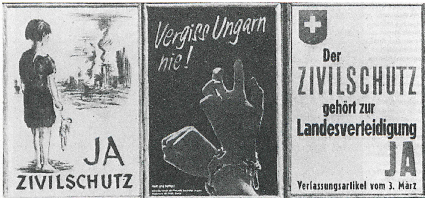
Manifesti per la votazione popolare del 2 e 3 marzo 1957 sull'articolo sulla protezione civile. Il manifesto al centro (aiuti all'Ungheria) si è trovato per caso lì affisso in mezzo ai manifesti sulla protezione civile, ma li ha completati in maniera esemplare.

L'UNIONE SVIZZERA PER LA PROTEZIONE CIVILE COMPIE 50 ANNI