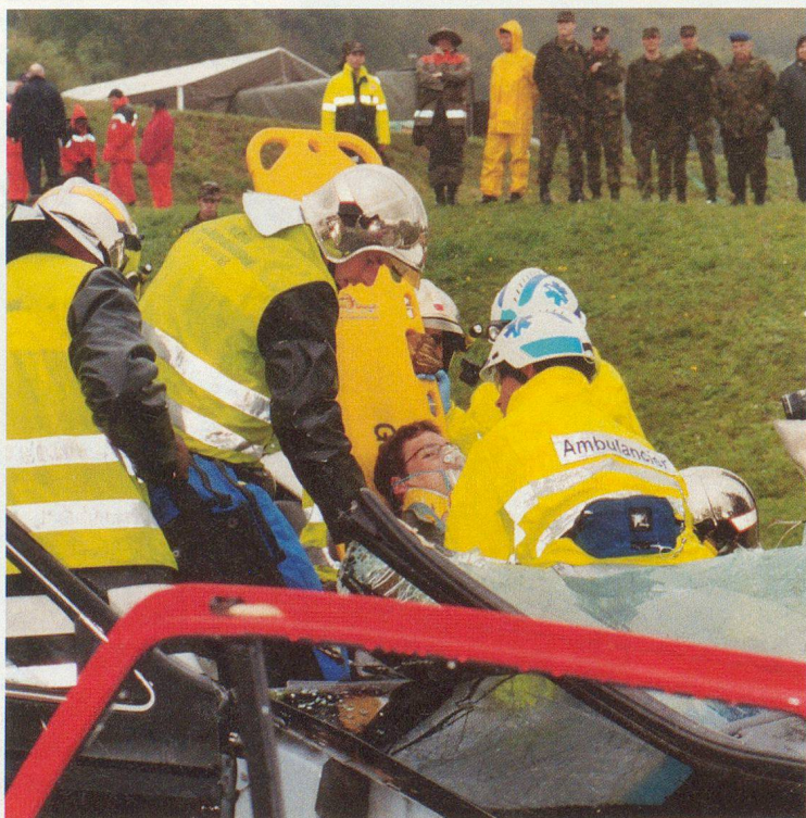
Transport du blessé après la découpe du toit du véhicule.

MED de la catastrophe; un gigantesque catalogue qui, pourtant, ne devrait déployer ses effets que lors d'événements majeurs.