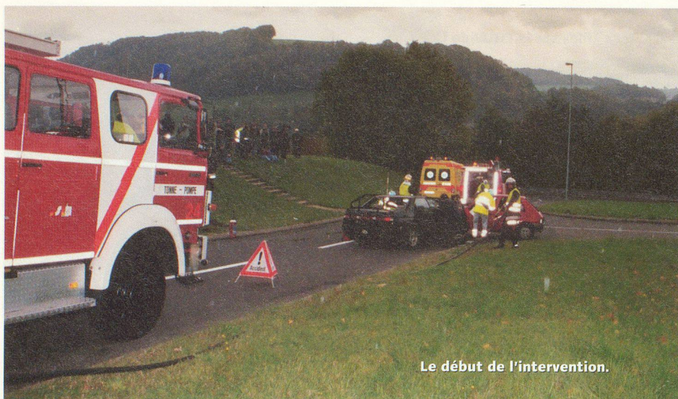
Le début de l'intervention.