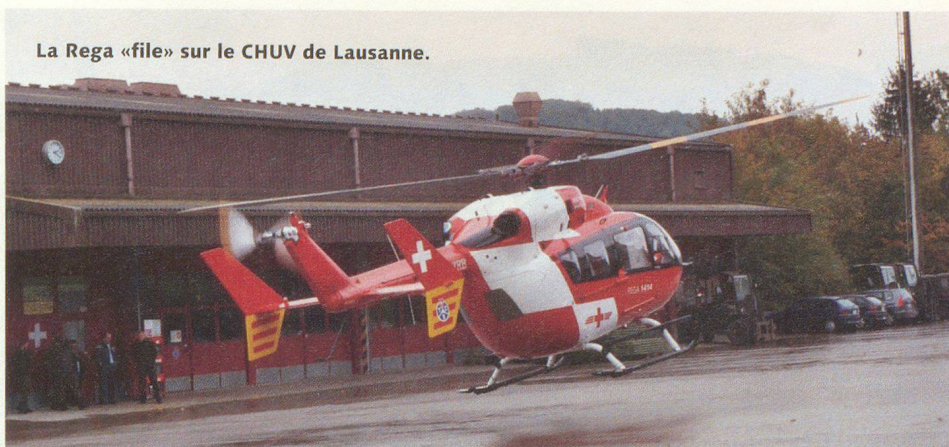
La Rega «file» sur le CHUV de Lausanne.