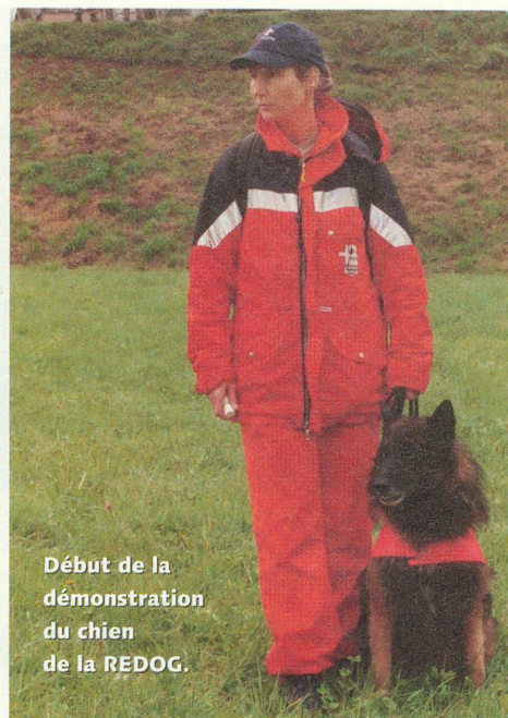
Début de la démonstration du chien de la REDOG.