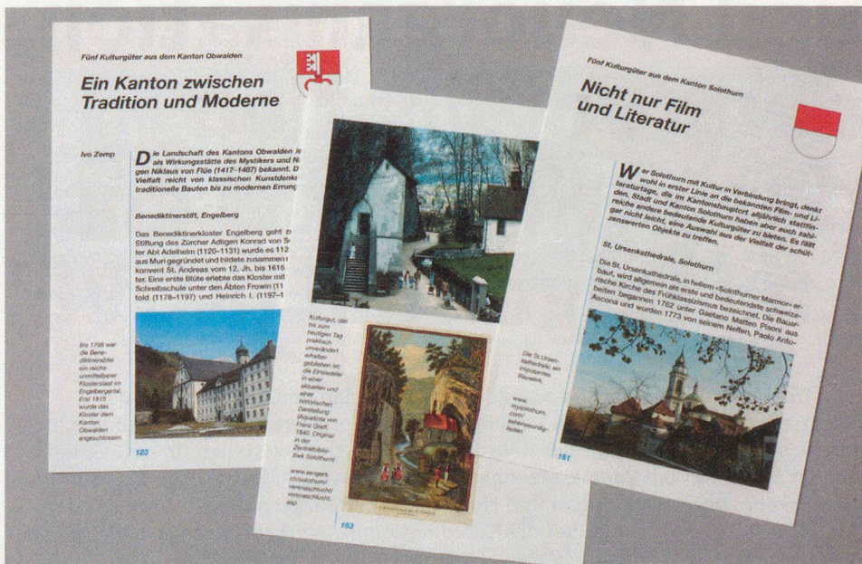
Beispiele von Kantonsteilen.

wortlichen in den Kantonen zählen, deren Kontaktadresse in den jeweiligen Kantonsteilen aufgeführt ist.