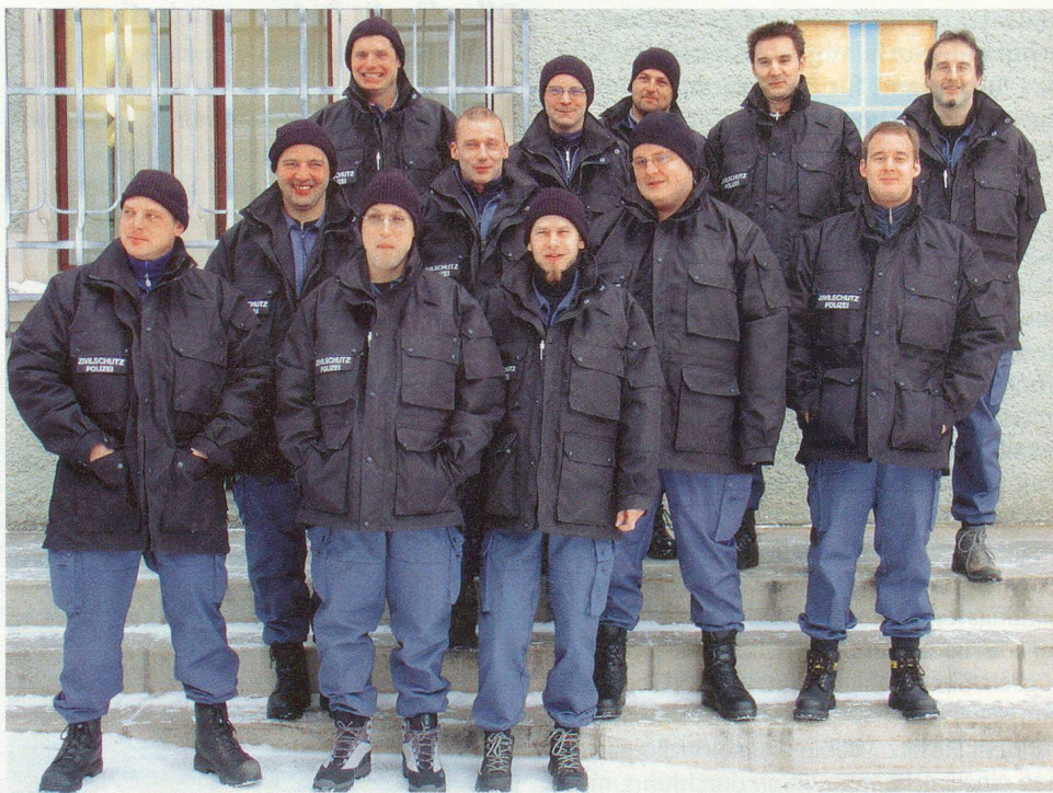
Zivilschutz-Polizisten in der neuen Einsatzbekleidung.

Der Zivilschutz-Sanitätsdienst des Kantons Graubünden stand am WEF 2005 zum dritten Mal mit 40 Sanitätern zur Unterstützung des öffentlichen Gesundheitswesens im Einsatz. Anlässlich eines Vorbereitungskurses im Zivilschutz-Ausbildungszentrum Meiersboden in Chur wurden die Sanitäter, zusammen mit Ärzten, Psychologen, Rettungssanitätern und Angehörigen der Armee, für diese Aufgabe vorbereitet. Vermittelt wurden die Themen Sanitätskonzept WEF 05, Mögliche sanitätsdienstliche Szenarien, Sanitätshilfsstelle Armee-Container und Spezielle Verhaltens- und Einsatzregeln.