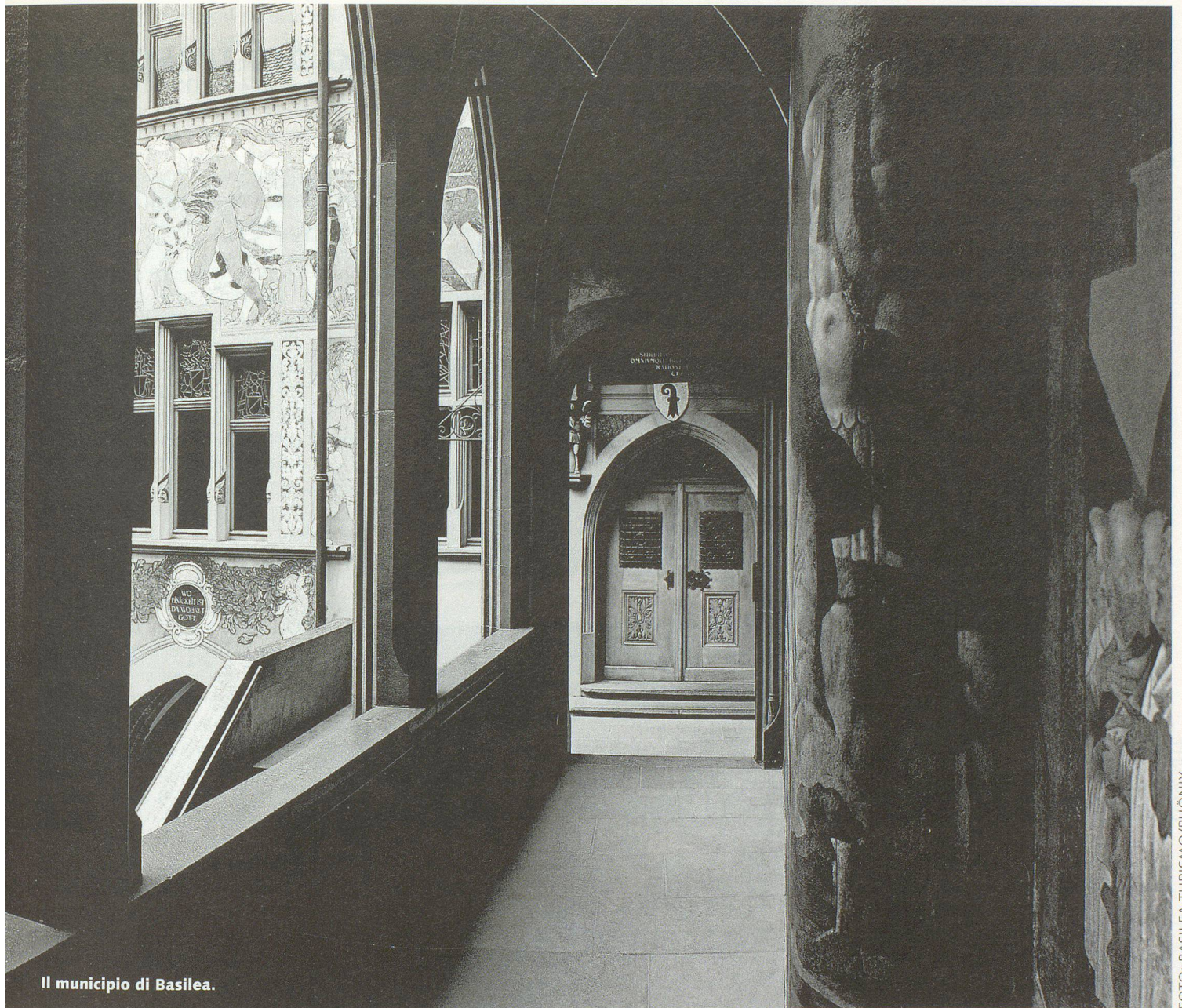
Il municipio di Basilea.