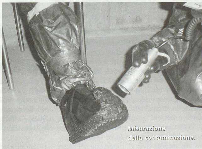
Misurazione della contaminazione.

UFPP. Nel caso di un evento d'ampia portata, entrano in azione diverse organizzazioni di soccorso e il personale competente. Il «Corso complementare per persone competenti in radioprotezione (nelle organizzazioni di soccorso)», impartito dall'Ufficio federale della protezione della popolazione, costituisce la formazione in radioprotezione prescritta dalla legge.