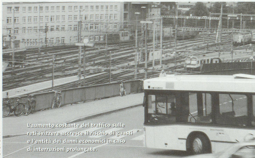
L'aumento costante del traffico sulle reti svizzere accresce il rischio di guasti e l'entità dei danni economici in caso di interruzioni prolungate.

UFT. I cambiamenti della situazione in materia di politica di sicurezza e l'aumento del volume di traffico sulle reti di trasporto svizzere pongono nuove sfide al settore dei trasporti. Con il coordinamento dei principali organi responsabili dei trasporti, la Confederazione intende creare le premesse per una migliore prevenzione e gestione dei trasporti in caso di catastrofi e di situazioni d'emergenza. A questo scopo il Consiglio federale ha approvato l'ordinanza concernente il coordinamento dei trasporti in caso di eventi dannosi (OCTE), ponendola in vigore a partire dal 1° ottobre 2004.