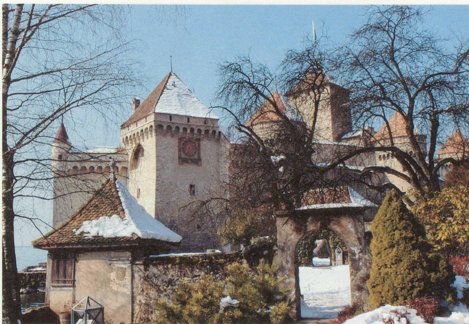
Le château de Chillon.