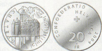
Médaille commémorative frappée par la Confédération.