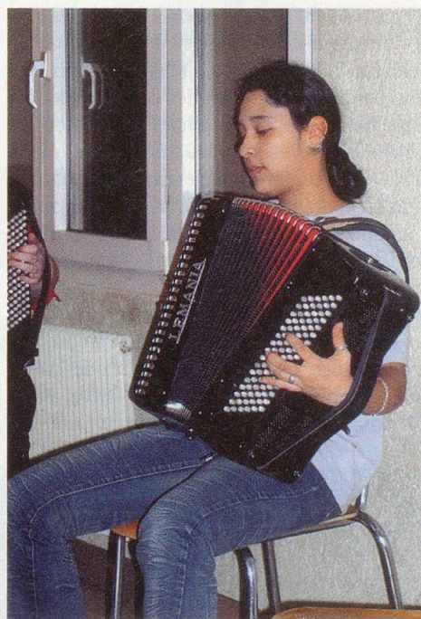
Une accordéoniste au grand cœur.

(Article réalisé avec la documentation fournie par la PCI de la Commune de Charrat; note de la réd.)