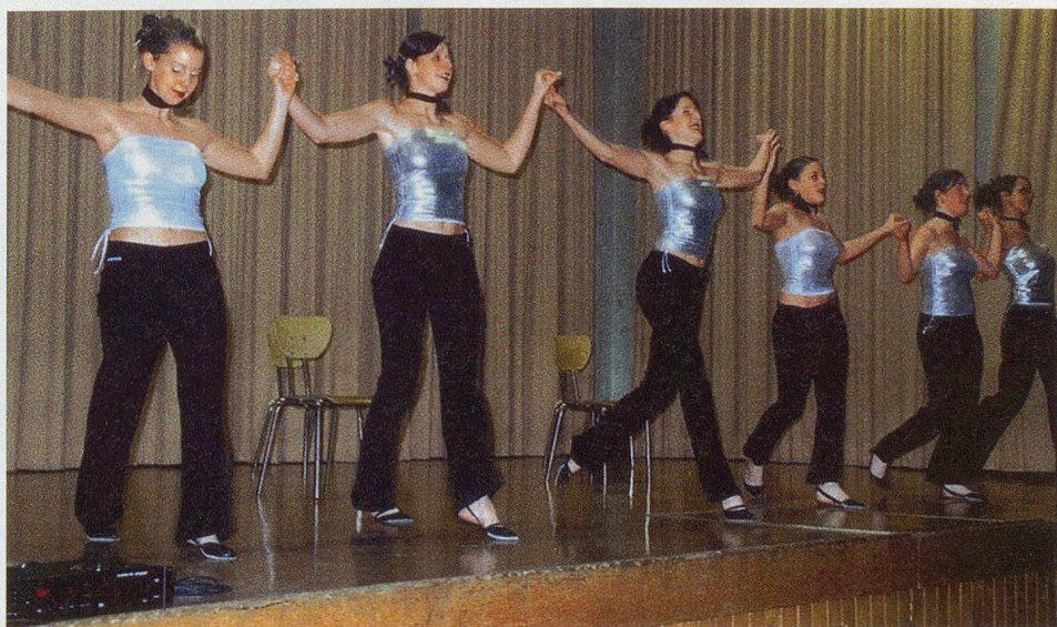
La société de gymnastique l'Helvétia.