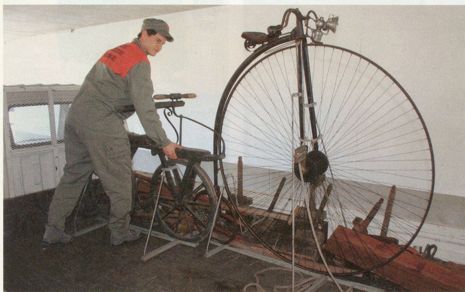
THUN: ZIVILSCHÜTZER ZÜGELTEN EXPONATE DES SCHLOSSMUSEUMS

Die Mittagspausen und die Abendanlässe boten Gelegenheit, mit anderen Teilnehmenden Erfahrungen auszutauschen und sich mit den verschiedenen Kulturen auseinanderzusetzen. □