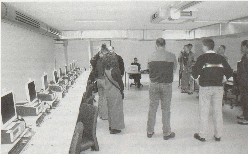
Raum für psychologische Tests: IT in Reih und Glied.