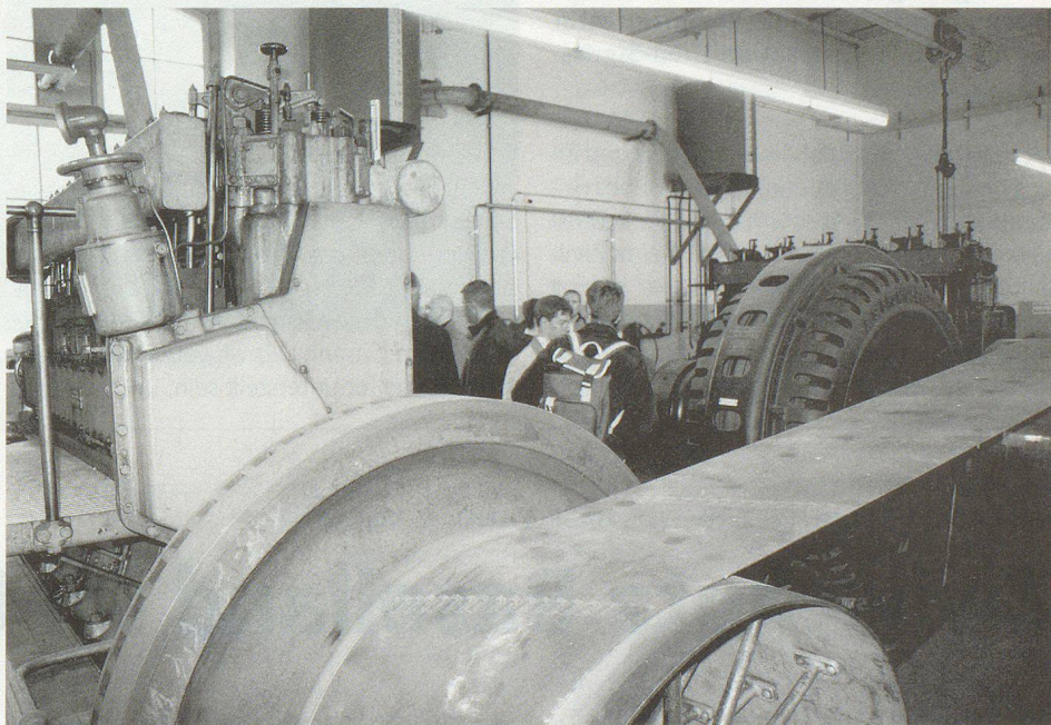
Beeindruckende alte Schiffsdiesel mit Generator – nicht für Orts-KP geeignet. Ob die neuen Notstromgruppen auch so alt werden?

Es werden neben den medizinischen unter anderem auch psychologische Beurteilungen vorgenommen, die es erlauben sollen, Hinweise zur Kadertauglichkeit zu geben. Dies bildet für die Kommandierenden eine gute Basis bei der Auswahl ihrer Kader bzw. Spezialisten. So wurde auch schon auf etliche Leute aufmerksam gemacht, die sich für den