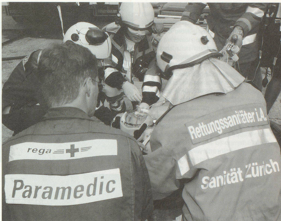
Il personale professionale dei servizi di salvataggio, dei servizi autoambulanze e della REGA (medici, medici d'urgenza, sanitari) si occupano dei feriti sul luogo del sinistro.