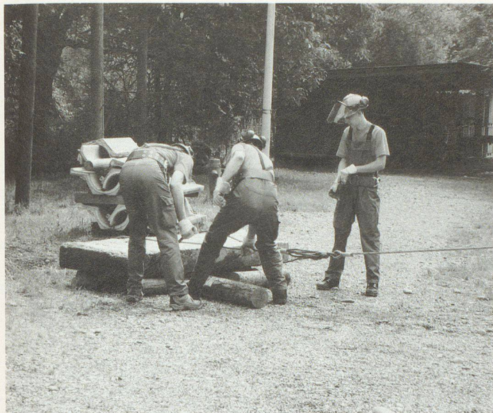
Wie werden schwere Lasten am sinnvollsten transportiert (Pioniere)?