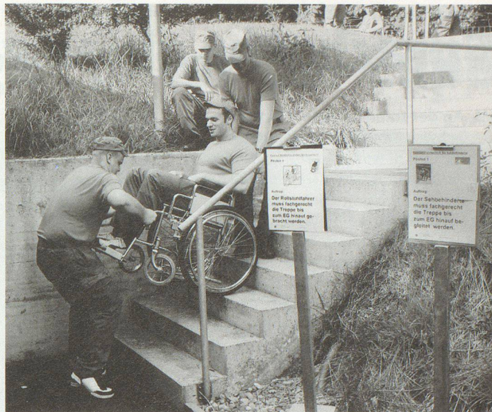
Rollstuhlfahren hat seine Tücken (Betreuer).

vorschriften werden unter anderem Antennen aufgebaut und Telefonleitungen verlegt.