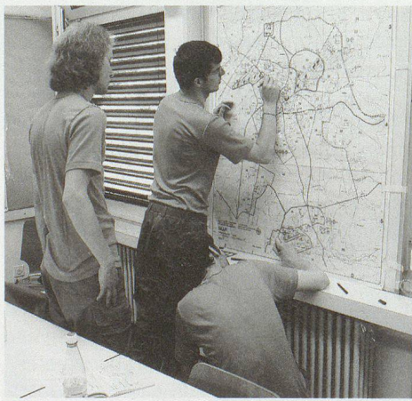
Stabsassistenten beim Nachführen einer Lagekarte.

Kernpunkt der Ausbildung bilden hier der Aufbau sowie das Betreiben und Unterhalten eines Funk- und Leitungsbaunetzes. Unter der Anwendung der zahlreichen Sicherheits-