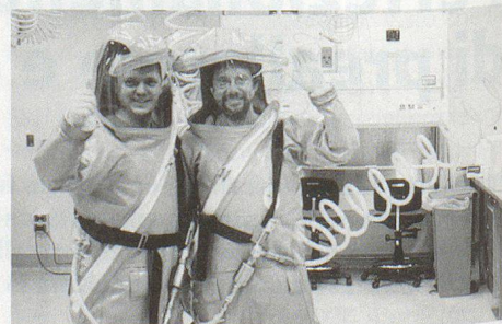
Il personale di un laboratorio biologico del grado di sicurezza 4 deve indossare una tuta di protezione speciale. Anche il futuro laboratorio di sicurezza del DDPS prevede l'impiego di queste tute.