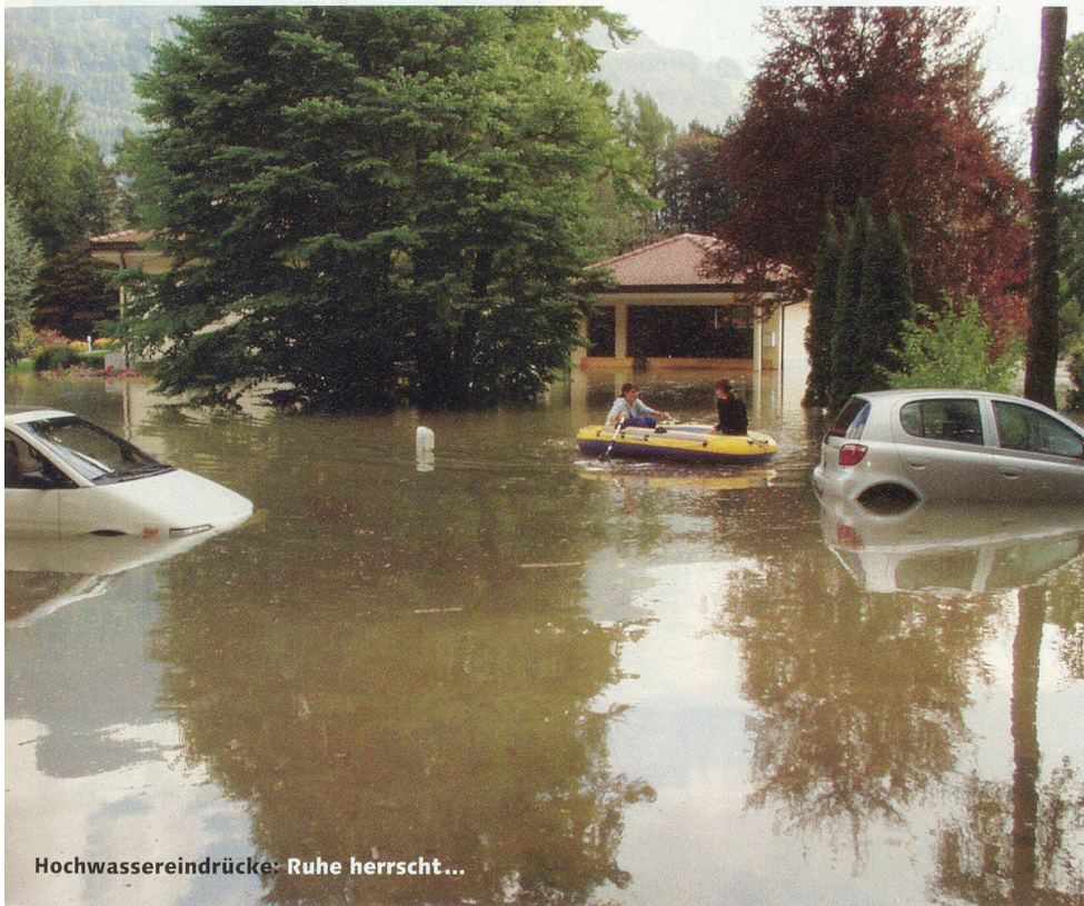
Hochwassereindrücke: Ruhe herrscht...