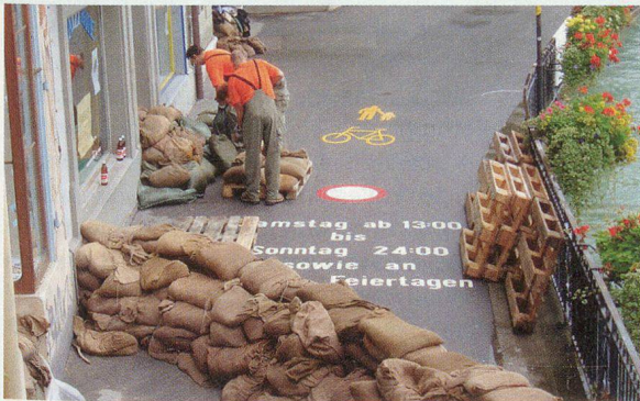
Unten: Sandsäcke – ein wertvolles Gut.