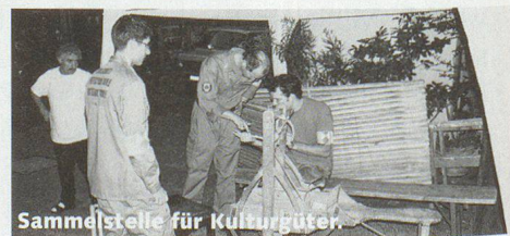
Sammelstelle für Kulturgüter.

Fortgesetzt wurde der Lehrgang mit den Themen Haftpflicht im Schadenfall, Befehlserteilung und Abfassen von Aufträgen. Die Aufträge wurden sogleich auf drei Arbeitsplätzen in die Praxis umgesetzt: