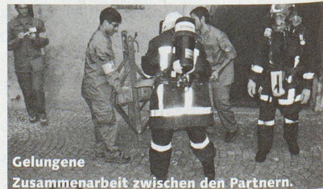
Gelungene Zusammenarbeit zwischen den Partnern.