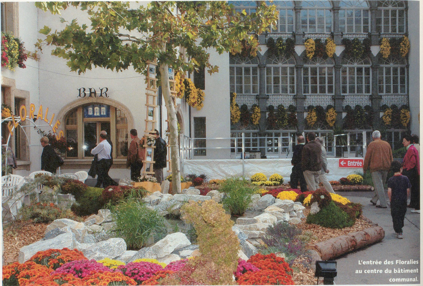
L'entrée des Florales au centre du bâtiment communal.