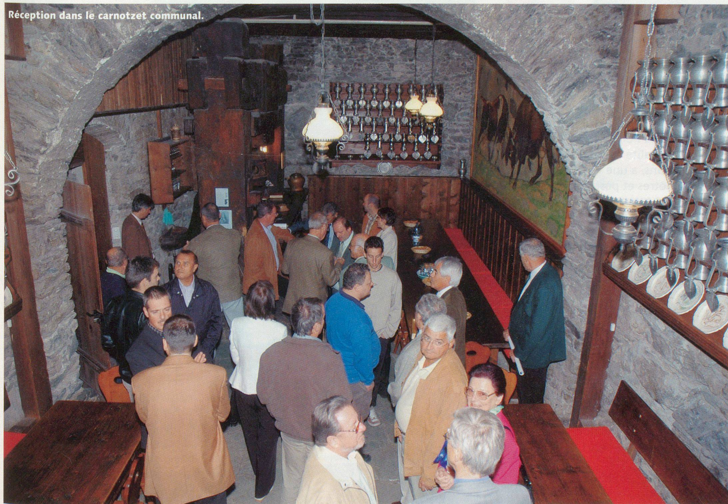
Réception dans le carnotzet communal.