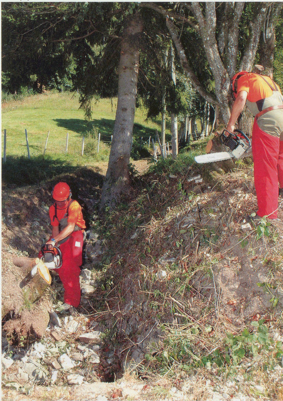
Une équipe nettoie les abords d'un ru alimentant la Grande-Eau.