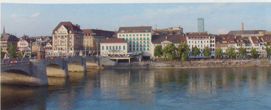
Blick nach Kleinbasel