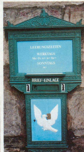
Der «Baslerdybli»-Briefkasten am Spalentor.