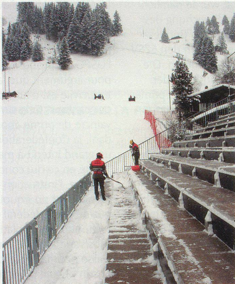
Schnee schaufeln, um Unfälle zu vermeiden. Im Hintergrund die Chuenisbärgli-Rennstrecke.