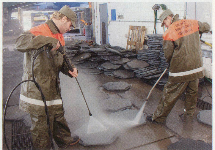
14 000 Bodenplatten sind mittels Hochdruck zu reinigen.

Zwei Wochen hatte der Aufbau der umfangreichen Infrastrukturanlagen für die traditionellen FIS-Weltcup-Rennen der Herren vom 7. und 8. Januar 2006 in Adelboden gedauert. Fünf Tage nach dem Anlass waren Abschränkungen, Tribünen, Zelte usw. weggeräumt. Die Zivilschützer leisteten eine vorzügliche Arbeit und hinterliessen einen ebensolchen Eindruck.