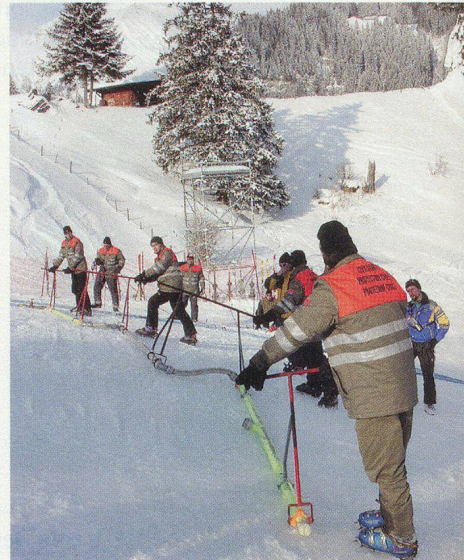
Einsatz für sichere Rennen.