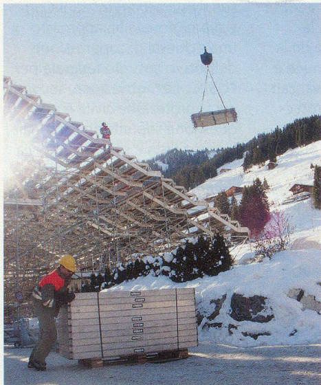
Abbau der Tribüne: hauptsächlich in Handarbeit, schwere Lasten mit dem Kran.