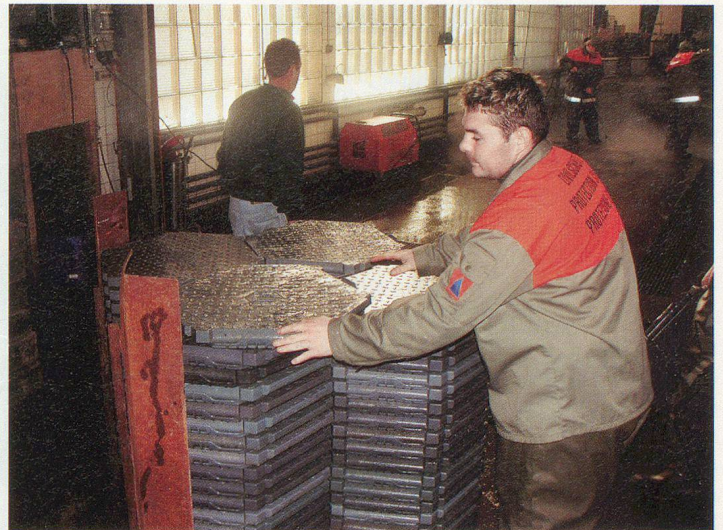
Bodenplatten stapeln – bis wieder eine der 30 Paletten transportbereit ist.