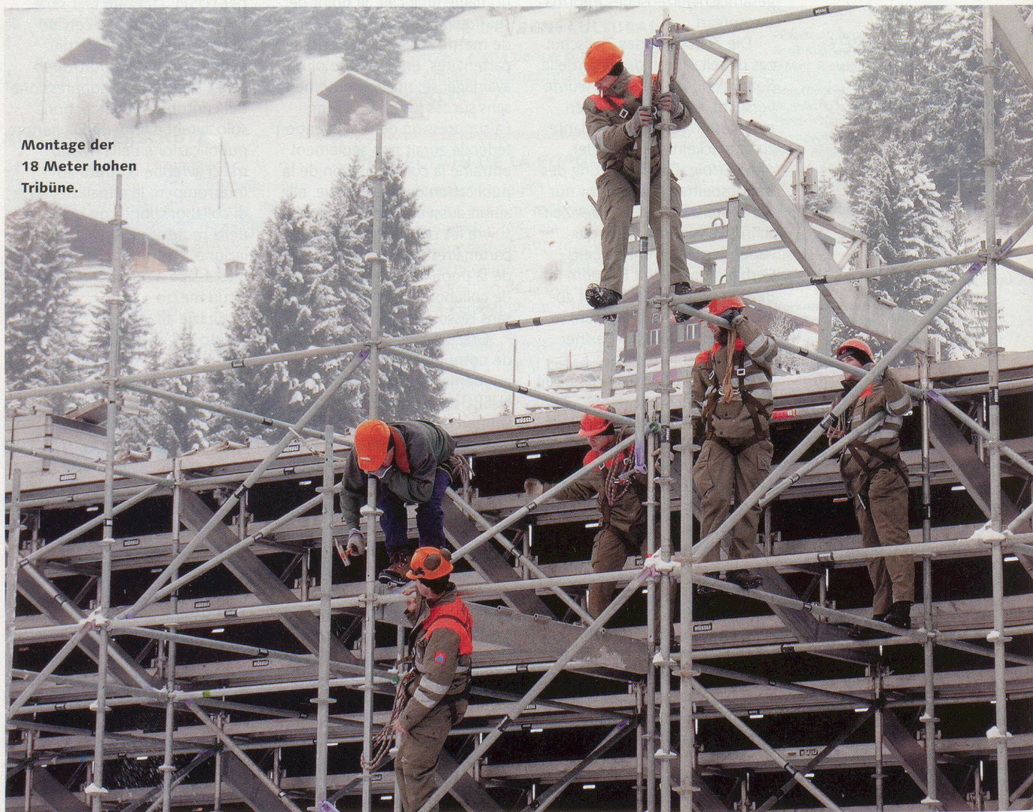
Montage der 18 Meter hohen Tribüne.