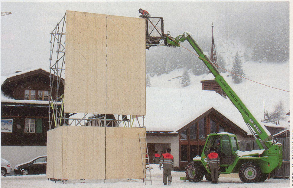
Grosse Maschinen für grosse Lasten.