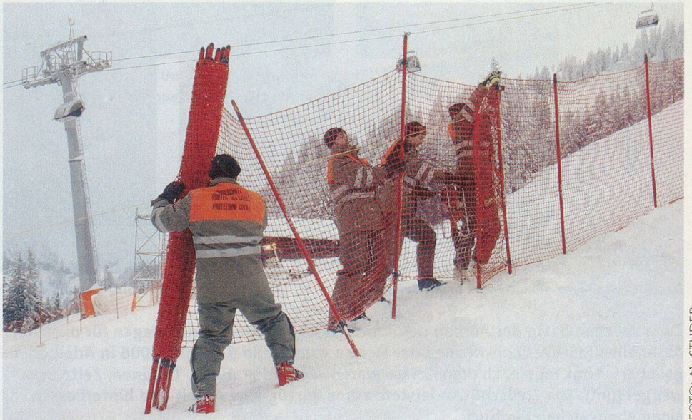
Einige der 15 000 Laufmeter Abschrankungnetze.