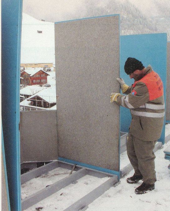
Viel Handarbeit ist gefragt.