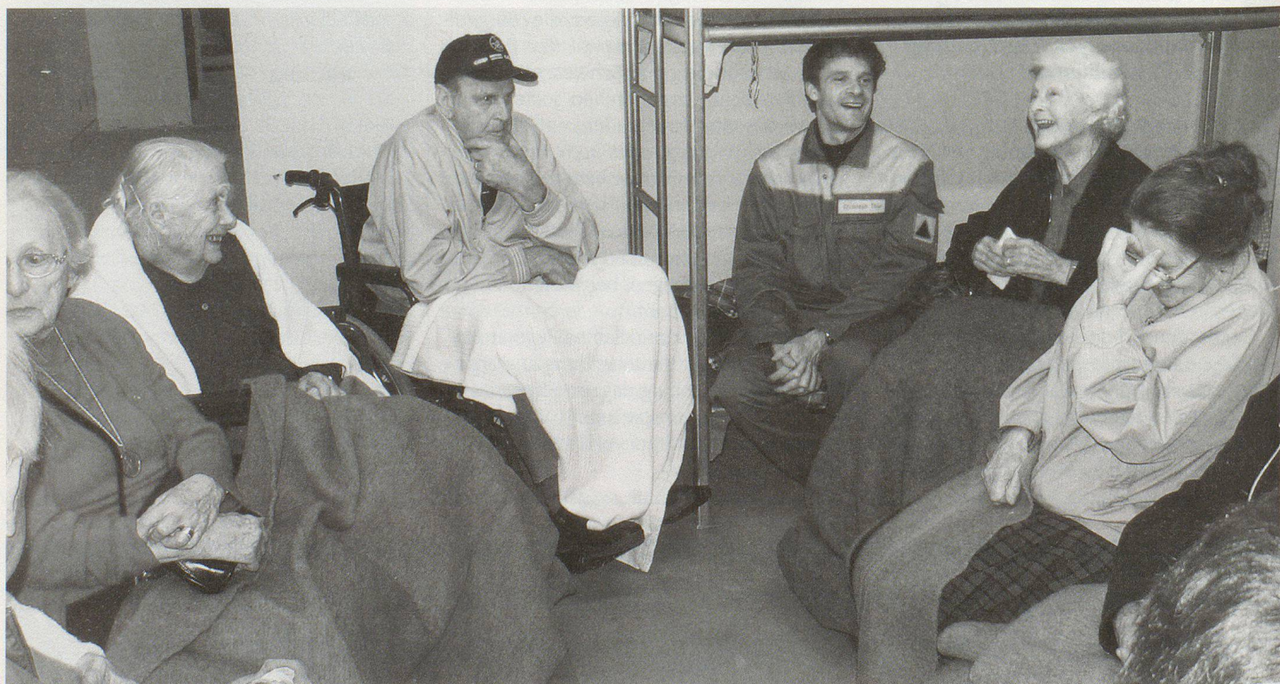
Bewohnerinnen und Bewohner des Alters- und Pflegeheims in der Zivilschutzanlage.

Am grossen Tisch in der Mitte des Raumes sitzen die Spezialisten des Kata-Stabs. Sie studieren Karten, nehmen fiktive Telefone von fiktiven Hausbesitzern entgegen, beraten sich untereinander. Die Kommunikation unter den verschiedenen Rettungsdiensten gestaltet sich schwierig. Die Seeretter sollten darüber informiert werden, dass sich eventuell Schiffe von ihrer Verankerung losgerissen haben. Die Zivilschützer müssen aufgeboten werden, die Verschüttung eines Bachbettes mit Geröll und Schlamm muss behoben werden. Das Dach des Altersheims Platten ist eingestürzt. Zivilschützer müssen eine Notunterkunft für die obdachlosen Alten organisieren und ihre Betreuung gewährleisten. Untergebracht wurden die zehn Senioren, die freiwillig an der Übung teilnahmen, in einer Zivilschutzanlage.