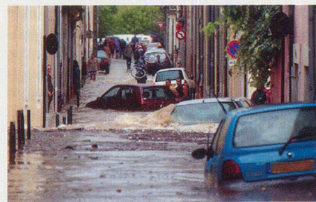
Une vue prise dans une rue de Nîmes (200 000 habitants).

Parmi les enseignements positifs, Pierre Maudet se réjouit de constater que dans ces circonstances, et malgré la fatigue engendrée par des travaux dans des conditions difficiles, voire dangereuses, point n'est besoin de motiver les troupes. D'un autre côté, dans cette