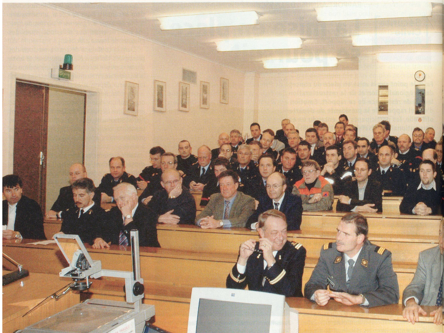
Le rapport annuel réunit les chefs ORPC et les Sapeurs-pompiers.

Les activités dans les OPC/ORPC (rapports, cours préparatoires pour les cadres et cours de répétition) se sont poursuivies en conformité des directives cantonales synthétisées dans le document «Activités 2005» en main de tous les chefs de corps.