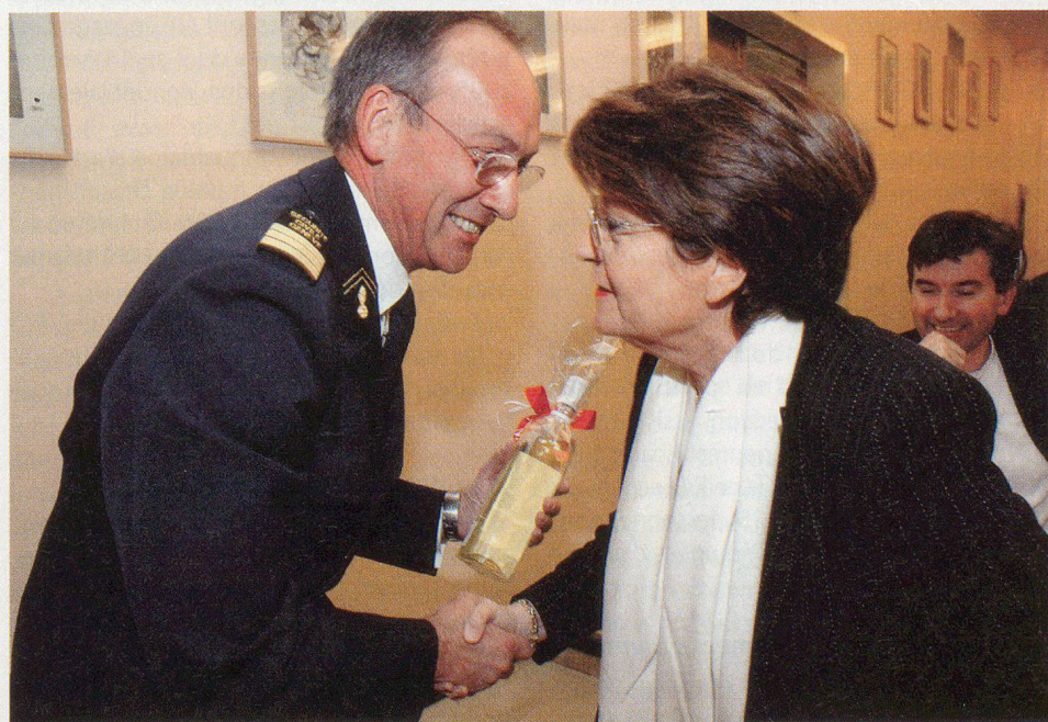
Un chaleureux au-revoir à Micheline Spoerri, conseillère d'Etat.

Comme prévu, les effectifs de la protection civile continuent à diminuer puisque avec 6629 astreints ou volontaires instruits, dont 75 femmes, nous constatons une diminution de 1516 personnes par rapport à l'année passée. L'effectif estimé pour Genève, dans le cadre de la PCi XXI, est d'environ 5000 personnes.