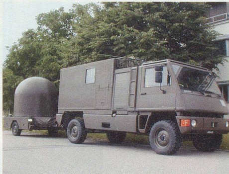
P-763+: die mobilen Elemente zum Start von Wetterballonen bei der Artillerie.

anderen Ort und – teilweise – auch mit anderen technischen Mitteln weiterzuführen. Modelle, die einen zivilen Leistungserbringer in allen Lagen definieren und eine subsidiäre