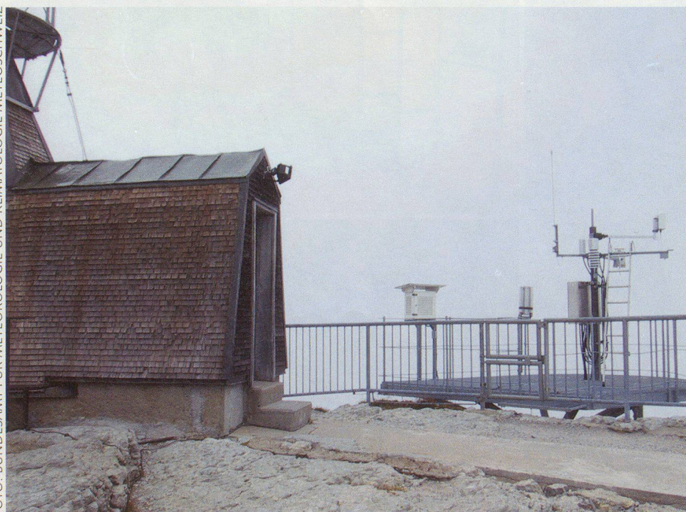
Wetterdaten von MeteoSchweiz dienen allen Partnern im Koordinierten Bereich Wetter. Die Wetterstation auf dem Sântis.

Der Artilleriewetterdienst (Art Wet D): Der primäre Auftrag des Art Wet D liegt in der lage- und zeitgerechten Bereitstellung von Wetterdaten zur Korrektur des Wettereinflusses auf die Treffgenauigkeit der Artillerie-