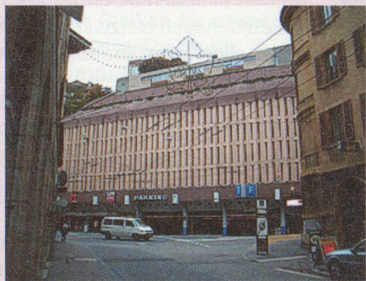
Stahlbeton Parkhaus (ganz kleine Öffnungen)