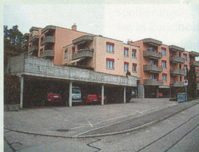
Wohnhaus, (Stein)Backstein, 2-3 SW