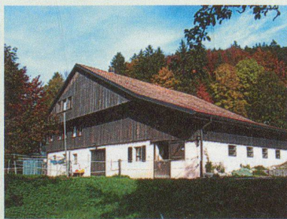
Bauernhaus (Stein + Holz)