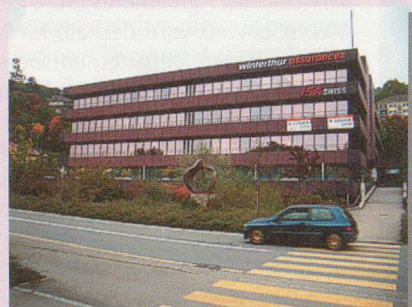
Breites (> 30 M.) Metall/verglastes Gebäude