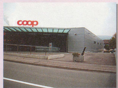
Supermarkt (Stahlbeton, Metall, ohne Öffnung)