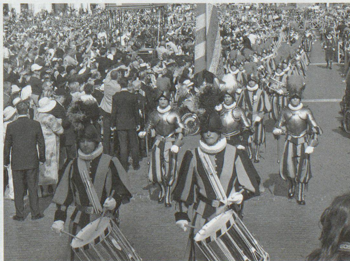
Bild links: Der Schwur auf die Fahne der Garde. Bild rechts: Einmarsch des Gardegeschwaders über die Piazza San Pietro vor die Basilika.